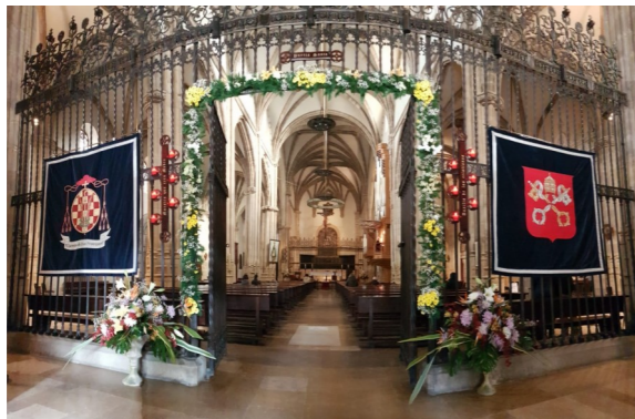
Puerta Santa Catedral Magistral